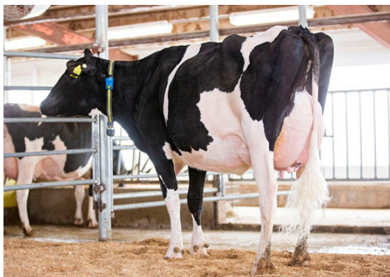
SIEMERS LSTR HANAN 33317 DAM