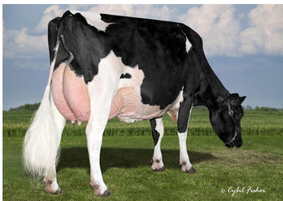
COOKIECUTTER MOG HANKER FOURTH DAM